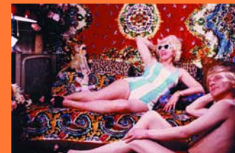
Die Bettwurst , Rosa von Praunheim

Noch keine Geschenke für Weihnachten? www.mustertussi.de